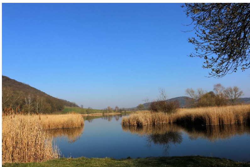
Torfstich bei Mühlberg

lizenzierter Wanderführer des Deutschen Wanderverbandes und Jugendwanderführer der Deutschen Wanderjugend