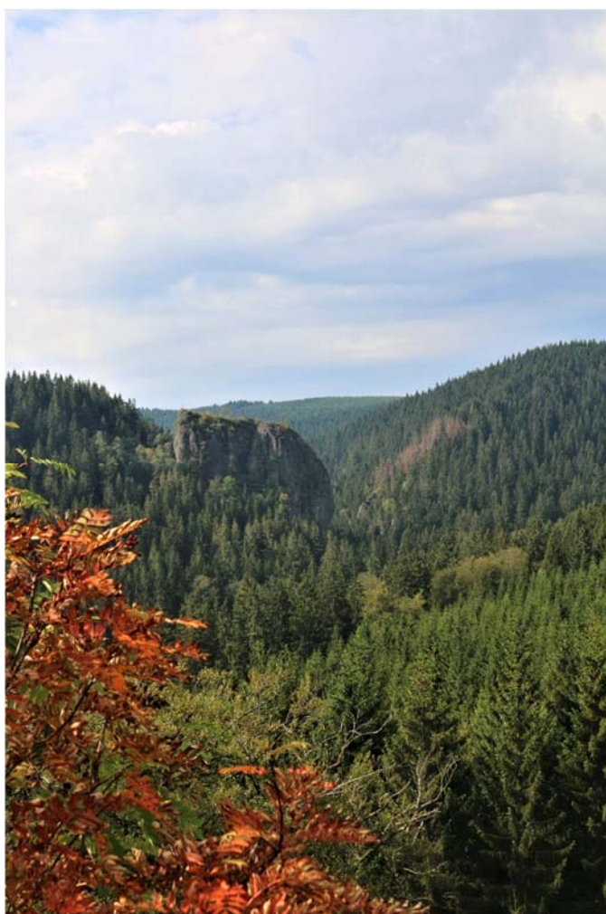
Blick zum Falkenstein