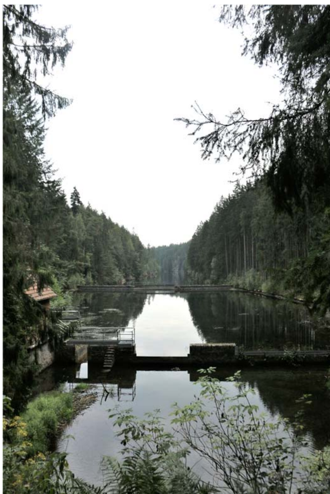
Alte Tambacher Talsperre

lizenzierter Wanderführer des Deutschen Wanderverbandes und Jugendwanderführer der Deutschen Wanderjugend