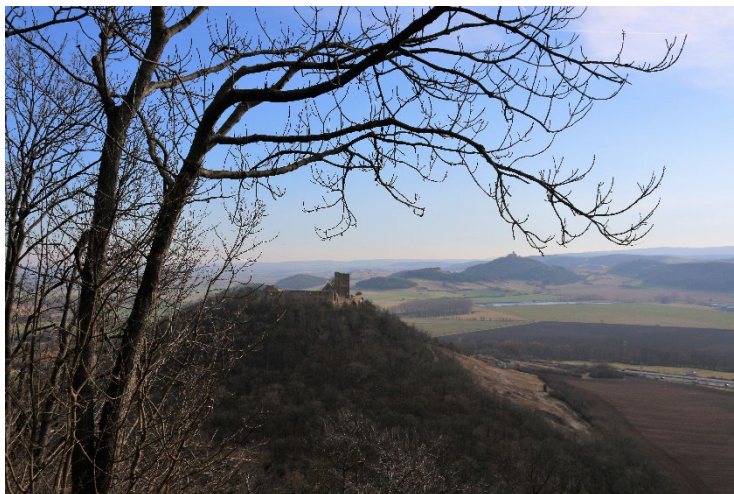
Blick vom Kaffberg